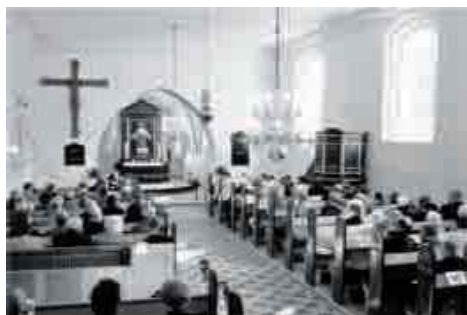
Festgudstjeneste ved geninvieelsen af Lumby Kirke

er startet med Kvartergudstjenester , hvor vi ved hjælp af husstandsomdeling søgte at få kontakt med andre grupper i sognet, for at fortælle, hvad vi laver og samtidig gøre lidt ”reklame” for Gudstjenesten og aktiviteterne omkring vore kirker i sognet. Aktivitetsudvalget arrangerer, som årlige tilbagevendende begivenheder bl.a. forårsfesten , pensionistudflugt , foredrag , koncerter og sangaftener . Vi søger at bidrage med særlige aktiviteter ved højtiderne bl.a.: De Ni Læsninger i julemåneden og Pinsen i Ord og Toner .