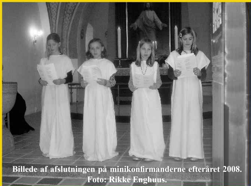
Billede af afslutningen på minikonfirmanderne efteråret 2008.

Minikonfirmander fra 4. klasse på Stige Skole og Stige Friskole kan begynde i Stige Sognehus til efteråret. Vi afslutter med en familiegudstjeneste, hvor minikonfirmanderne deltager 2. søndag i advent d. 6. december i Stige Kirke.