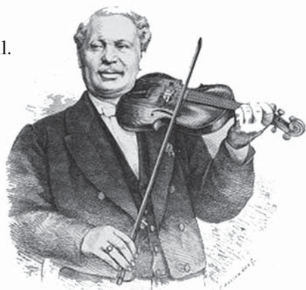
H. C. Lumbye 1810-1874