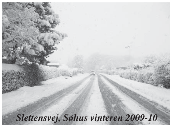
Slettensvej, Søhus vinteren 2009-10

Læs mere i næste kirkeblad og på vores hjemmeside!