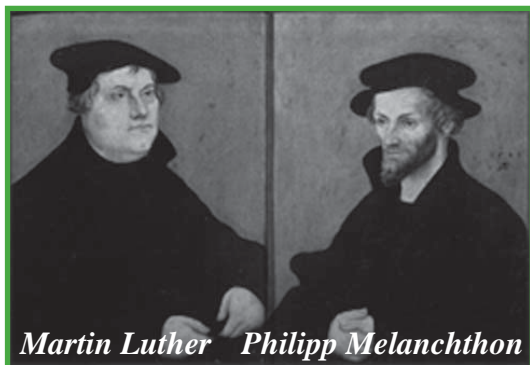
Martin Luther Philipp Melancthon