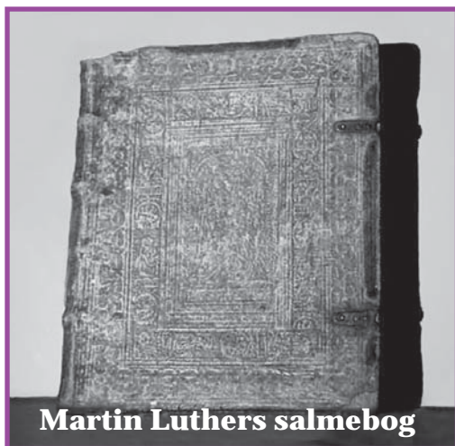
Martin Luthers salmebog