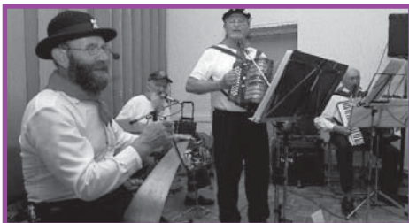
Jordløse Gårdmusikanter underholder ved forårsfesten.

Menighedsrådet indbyder sognenes ældre til forårsfest, som vi plejer. I år får vi besøg af Jordløse Gårdmusikanter. De synger gårdsangerviser fra årene 1920 – 60 for os, og der bliver også rig lejlighed til, at vi alle kan synge med. Der serveres kaffebord til en pris af 40 kr.