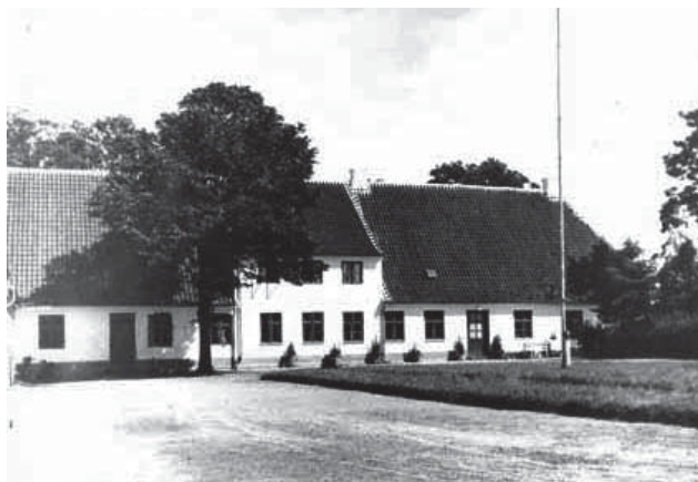
Amtsprøvt Lützens gamle Præstegård (Fjernet i 1951 til fordel for den nuværende præstegård)