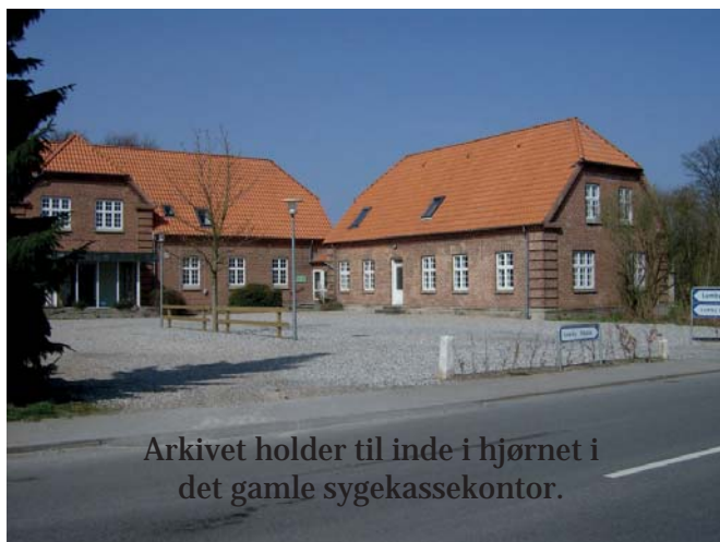
Arkivet holder til inde i hjørnet i det gamle sygekassekontor.