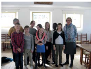
Minikonfirmanderne fra palmesøndag 2012 og 2013